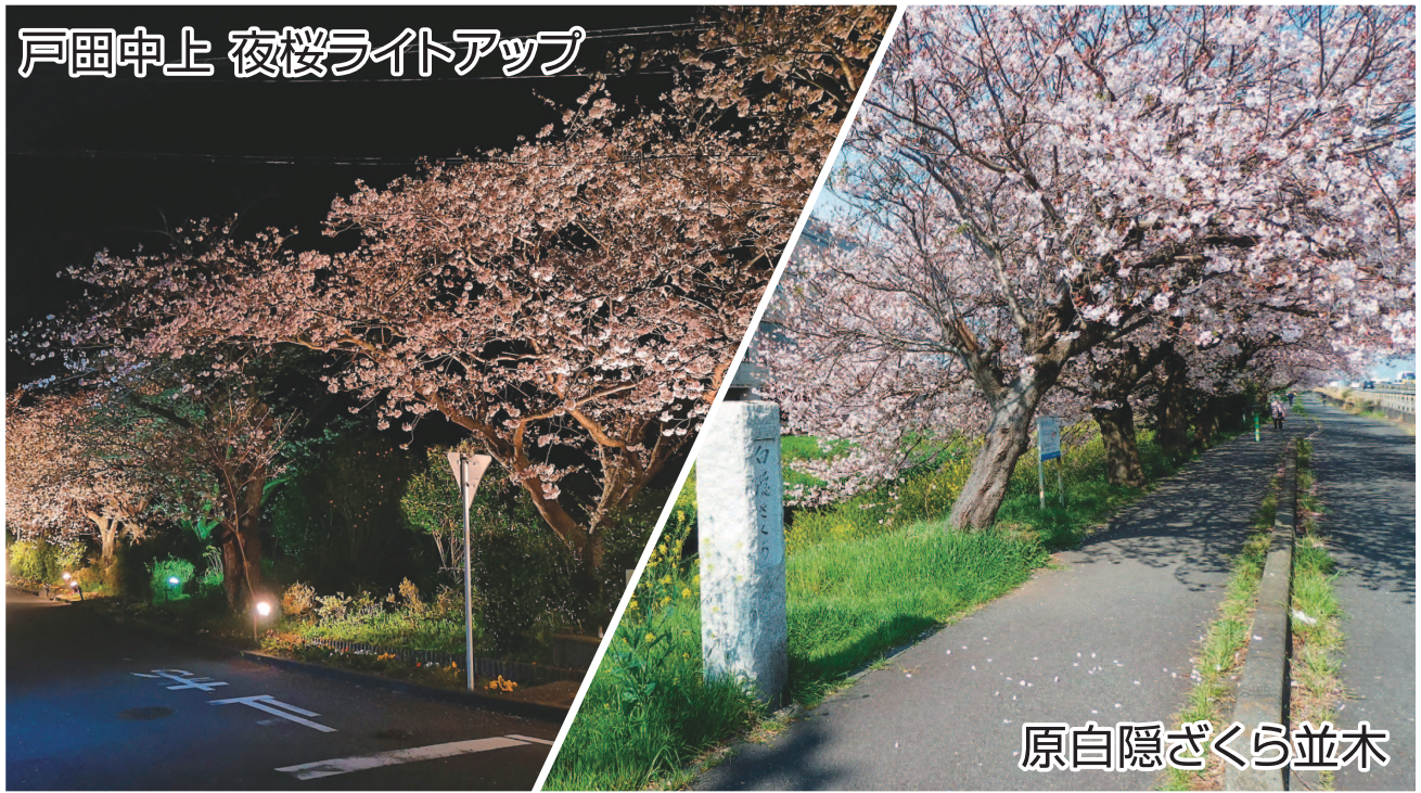
戸田申上 夜桜ライトアップ

No. 110 発行者 沼津市商工会 会長 渡邊好孝 〈本所・原支所〉沼津市原1200番地の1 TEL(055)966-1331 FAX (055)967-4925 〈戸田支所〉沼津市戸田1028番地の5 TEL(0558)94-2224 FAX (0558)94-4029 編集 沼津市商工会広報委員会